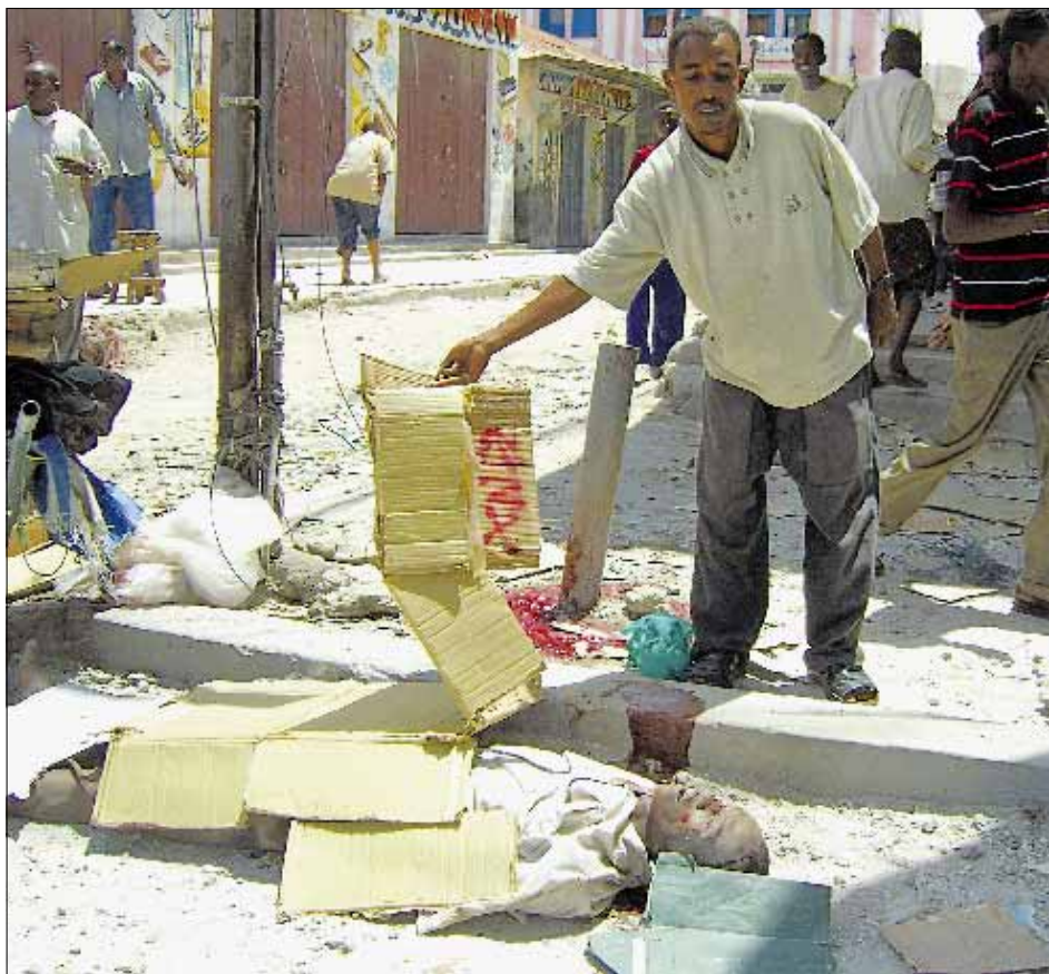
Strage di civili nella capitale somala